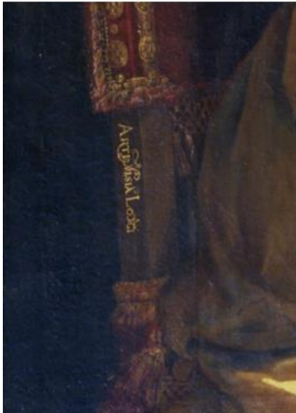
Abb. 5: Artemisia Gentileschi, Heilige Maria Magdalena (Detail), um 1615/16, Öl auf Leinwand, 146,5 x 108 cm. Palazzo Pitti, Florenz, Ident. Nr. 1914 n.142.

Abbildungsnachweis , der transparent macht, woher Sie Ihr Bildmaterial entnommen haben (→ Kapitel 10 ).